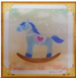
12月は来年の干支うまです

パステルアートを楽しんでみませんか？パステルをパウダー状に削って指でくくるして描きます。絵の好きな方も、絵心がない、自信がないという方も楽しめます。 お子さんはパステルに触れ、感触や色を楽しみます。 *お絵描きの難しいお子さんは同室で保育者と遊びます。 講師：福田真弓先生（パステル和（なごみ）アートインストラクター） 時間：10:00～11:30 定員：4組